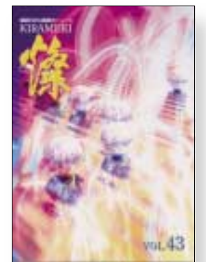
燦 (きらめき) (ひょうこ科学技術協会 Vol.43で廃刊) 2002年10月18日 収集