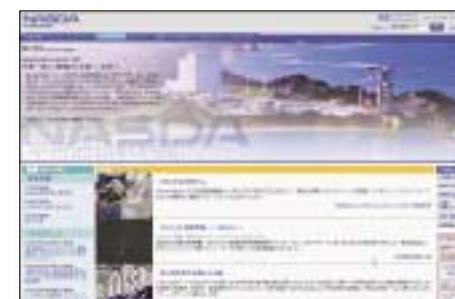
宇宙開発事業団 (2003年10月1日 宇宙航空研究開発機構に) 2003年9月30日 収集

これらは既に 閉鎖されたサイト、 廃刊した電子雑誌です。 WARPでなら ご覧になれます。