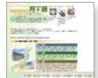
奈良県 月ヶ瀬村 (2005年4月1日 奈良市に) 2004年12月23日 収集

これらは既に 閉鎖されたサイト、 廃刊した電子雑誌です。 WARPでなら ご覧になれます。