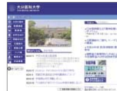
大分医科大学 (2003年10月1日 大分大学に) 2003年9月19日 収集